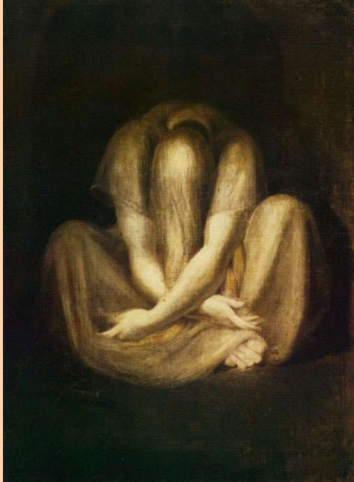
Füssli, Il silenzio (1799-1800) Zurigo, Kunsthaus