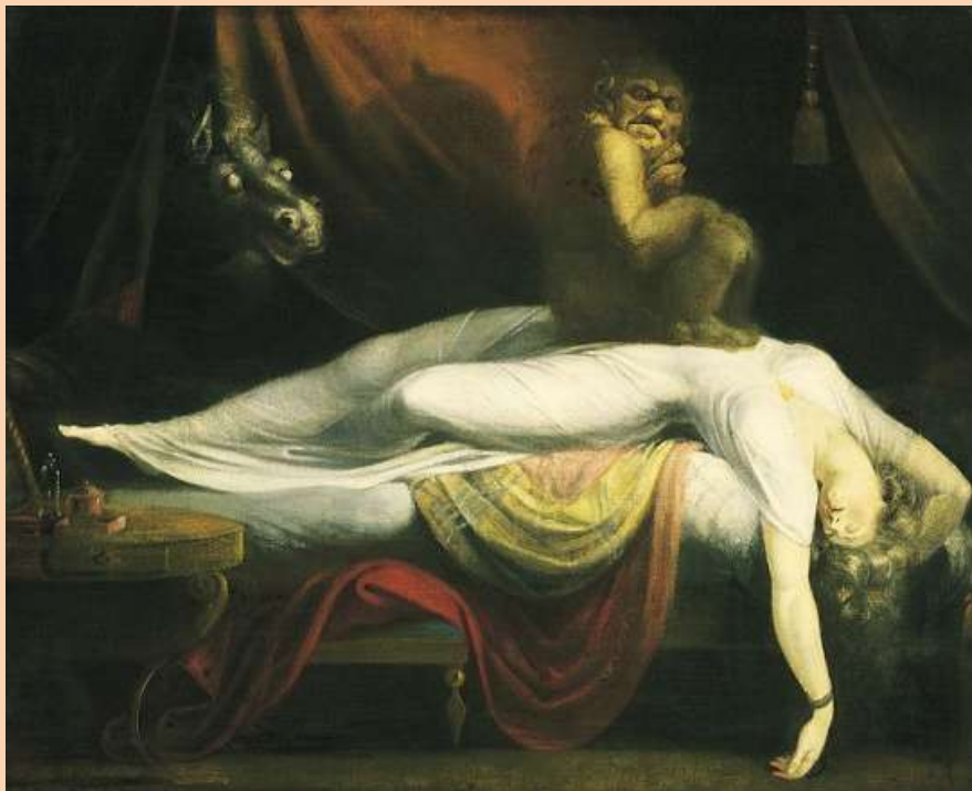
L'incubo , 1781. Olio su tela. cm. 101,6X127. Detroit, Insitute of Arts